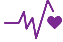
Sağlıklı olma ve refah